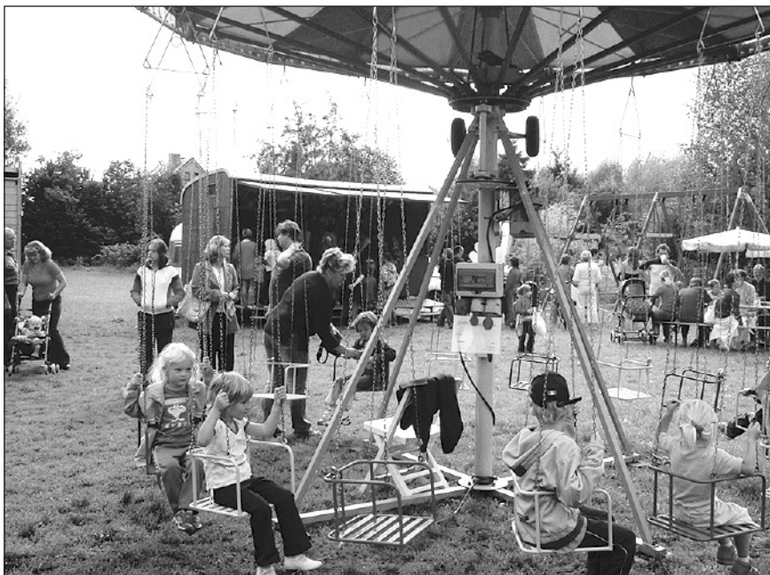
Posvícenského veselí si užívaly hlavně děti.