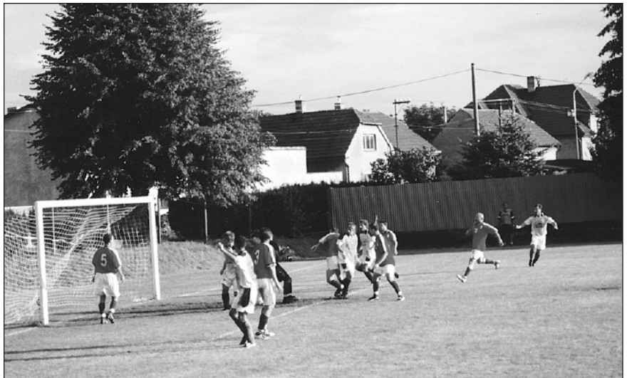
Nedělní posvěcený zápas Kostomlaty - Pátek.