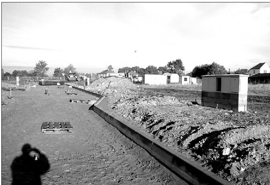
Výstavba inženýrských sítí pro 39 RD.

Tímto vyzýváme naposledy občany Kostomlat, kteří mají zájem o přípojku vodovodu, aby se přihlásili na obecním úřadě do konce tohoto roku. Cena za přípojku však již bude 12.500,-Kč. Po tomto termínu se již nebude moci nikdo přihlásit.