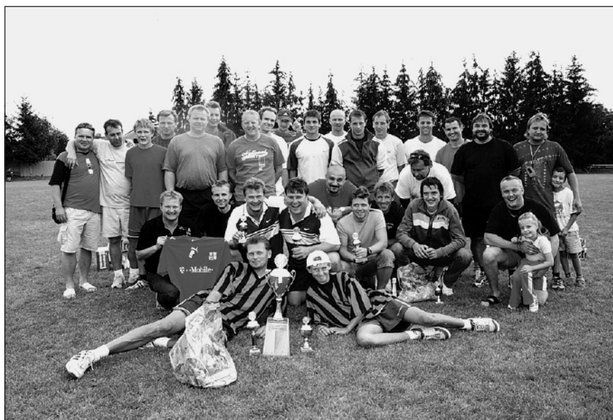
Účastníci posvícenského sedmiboje.