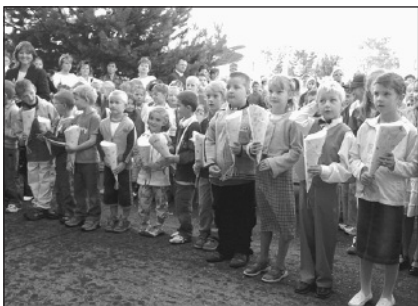
Prvnáčekové na zahájení nového školního roku.