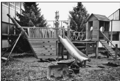
Dostavba dětského hřiště u ZŠ se blíží ke konci.

Některé změny jsou však pro všechny školy závazné už od tohoto školního roku. Cizí jazyk se bude nově povinně vyučovat už ve třetí třídě, tím žákům na 1. stupni přibyla tři vyučovací hodiny týdně, dále přibyla hodina žákům v 6. ročníku, v našem případě byl posílen český jazyk a posílena byla o hodinu výuka světového jazyka v 8. ročníku. Změny se děly již od roku 2003, kdy přibyla hodina pro 8. a 9. ročník v podobě českého jazyka, v roce 2004 byla o hodinu posílena výuka světového jazyka v 7. ročníku,