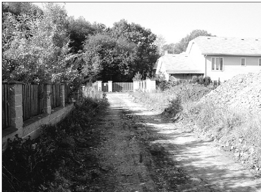
Příprava na rekonstrukci ulic Krátká a Pod Beránkou.