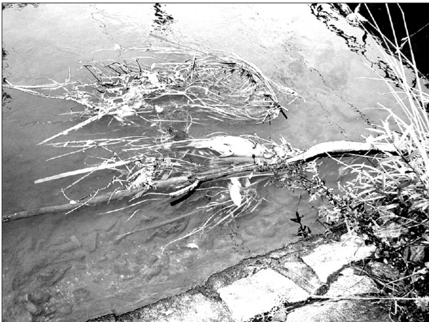
V úterý 26.9. unikla z Cukrovaru Dobrovice údajně melasa, která otrávil část Vlkavského potoka včetně území u nás. Týden po této ekologické katastrofě je potok prázdný, při březích se však drží uhynulé ryby.