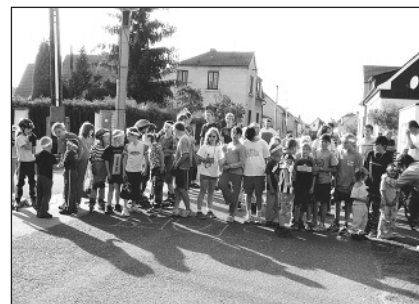
Účastníci letošního Běhu Terryho Foxe.